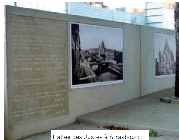
L'allée des Justes à Strasbourg.

Ce sont en partie les paroles du chant repris assez souvent lors d'obsèques, en hommage à ceux qui, humblement, naturellement ont vécu en ayant le souci des autres, en les