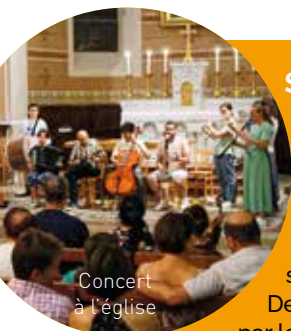
Concert à l'église