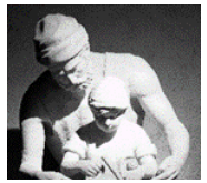
Année Saint Joseph

« le Fils de l'homme n'est pas venu pour être servi, mais pour servir, et donner sa vie en rançon pour la multitude » Saint Marc 10, 45