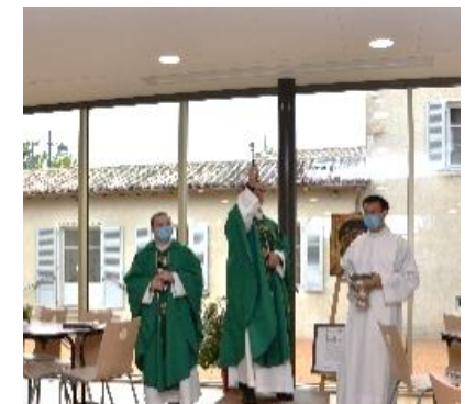
Bénédiction des nouveaux locaux